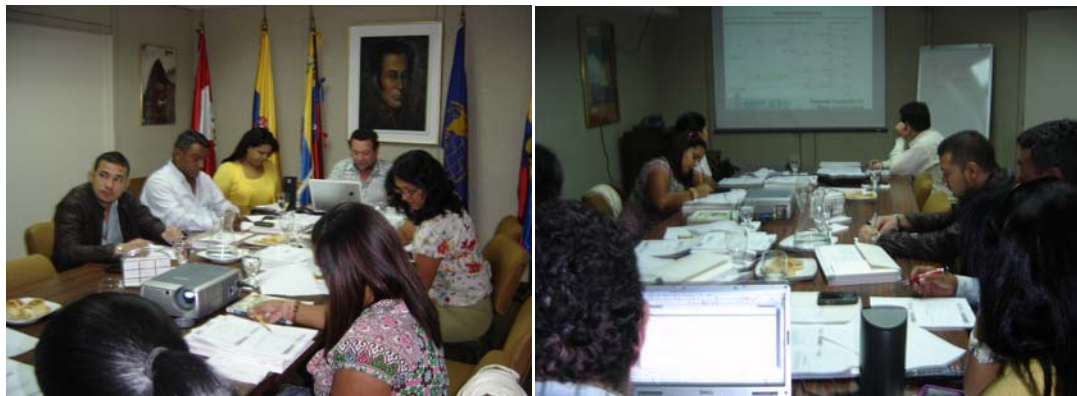
PARTICIPANTES RECIBEN EL CURSO A TRAVES DE VIDEO CONFERENCIA

El Programa de Sanidad Agropecuaria e Inocuidad de Alimentos (SAIA) del IICA y el Centro de Modelaje de Enfermedades Animales y de Vigilancia de la Facultad de Veterinaria de la Universidad de California-Davis, llevaron a cabo, por medio del Centro de Capacitación a Distancia (CECAD), un Curso Regional sobre Evaluación del Riesgo en Salud Animal.