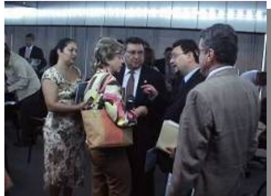
INSTITUCIONES CONTRAPARTES FELICITAN AL REPRESENTANTE DEL IICA EN VENEZUELA