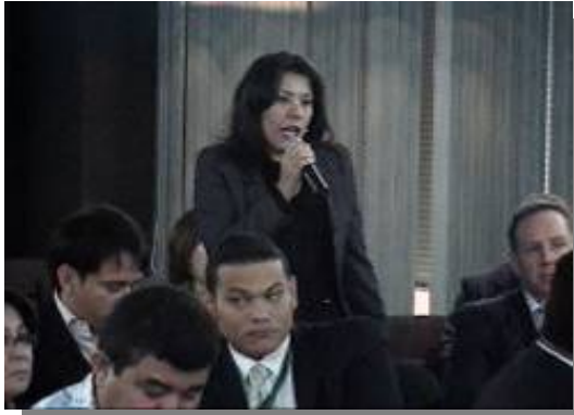
Dra. Francesca Panepinto de la Asamblea Nacional