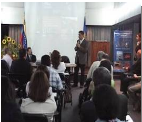
Viceministro de Desarrollo Rural integral del MPPAT

Entre las instituciones con las cuales se desarrollaron acciones de cooperación técnica durante el 2007, se mencionan: Ministerio del Poder Popular para la Agricultura y Tierra, Ministerio del Poder Popular Lara la Educación, Ministerio del Poder Popular para la Salud, Ministerio del Poder Popular para la Ciencia y la Tecnología, Ministerio del Poder Popular para la Planificación y Desarrollo, Ministerio del Poder Popular para la Alimentación, SASA, INIA, INHRR, Asamblea Nacional, Gobernación del estado Portuguesa, Alcaldía Andrés Eloy Blanco, SHYQ, FUDECO, FUNDACITE Aragua, EDELCA, FUNDAVER, FUNDHAINFA, UCLA, LUZ, UCV, APHIS, BID, CIEA, CODESSER, FAO, OPS y SELA.