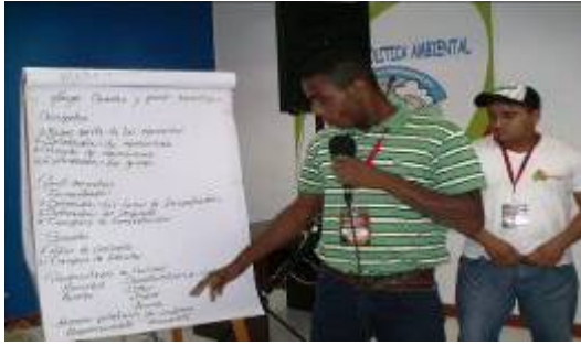
Dinámica de Grupo Oderi