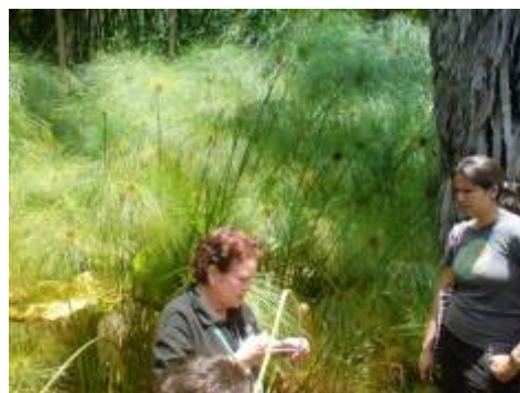
La guía muestra especie de papiro

Fue fundado en 1944, siendo así el primero constituido del país, y formó parte del proyecto original de la Ciudad Universitaria de Caracas. Además de albergar un importante instituto de investigación y una amplia colección de arte, el jardín fue nombrado conjuntamente con la ciudad universitaria como Patrimonio de la Humanidad por la UNESCO.