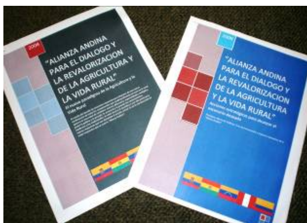
Principios, Políticas, Áreas de Intervención y Aspectos Operativos de la Alianza Andina