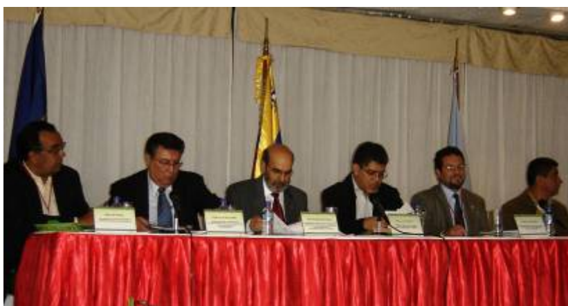
Evento presidido por el Ministro de Agricultura, Elías Jaua

El IICA, el Ministerio del Poder Popular para la Agricultura y Tierra (MPPAT), la Organización de las Naciones Unidas para la Agricultura y la Alimentación (FAO), EMBRAPA y los organismos adscritos al MPPTA participaron de la organización y desarrollo del Simposio: “Sistemas de Investigación, Transferencia y Extensión de Tecnología Agrícola en Venezuela: Antecedentes, Situación Actual y Perspectiva” , en el cual fueron revisados aspectos técnico operativos que responden al mandato del sector agrícola en cuanto a su orientación, apoyo, y promoción de la coordinación efectiva y participativa, entre los actores que conforman el Sistema Nacional Generación y Transferencia de Tecnología (SNGTT). El objetivo de dicho simposio fue construir las bases para la puesta en marcha del Sistema de Extensión y Capacitación, agrícola bajo las directrices del Proyecto Nacional Simón Bolívar.