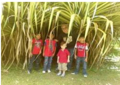
Hijos de trabajadores del IICA