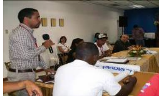
Participación del MPPAT