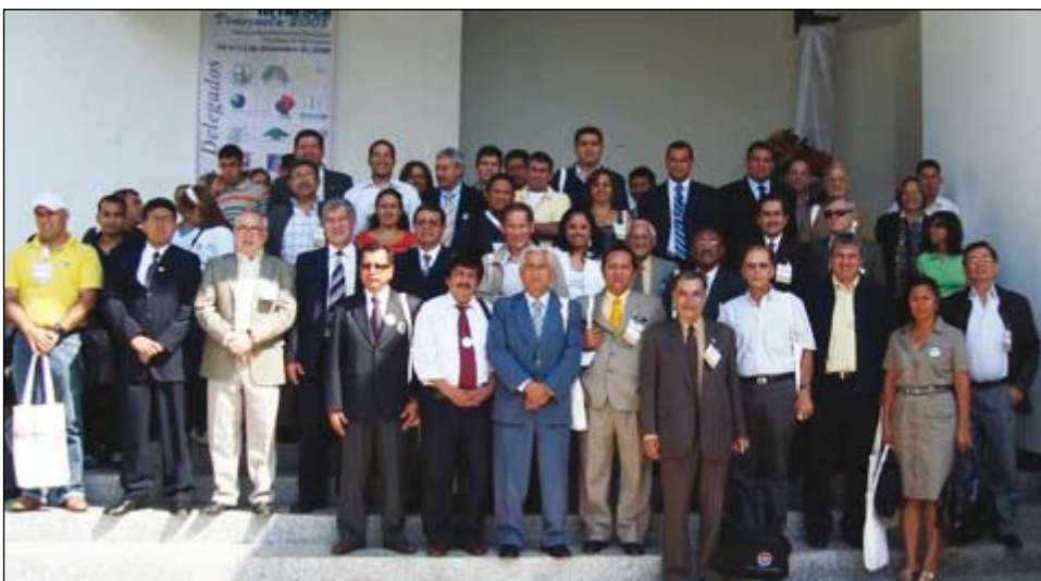
Participantes del IX FRADIEAR celebrado en Maracay, estado Aragua

La oficina del IICA jugó un rol importante en la articulación de acciones con las instituciones de educación superior, mediante la realización de talleres, seminarios, foros y charlas, tanto en el Foro Regional Andino para el Diálogo y la Integración de la Educación Agropecuaria y Rural (FRADIEAR); como también con el Núcleo de Decanos de las Facultades de Agronomía, Veterinaria, Ciencias del Mar y Afines y con la Comisión Sectorial de Extensión Rural de las Universidades Venezolanas (COSERUV).