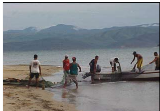
Pesca artesanal en Venezuela

Otro campo de atención del Instituto será el trabajo para la construcción de propuestas que agreguen valor a los esfuerzos logrados a la fecha en las áreas de seguridad alimentaria y desarrollo territorial, con especial énfasis en las propuestas «Diversificación de la Oferta Alimentaria para Poblaciones Vulnerables, Utilizando Cultivos Nativos»; «Universidades y Territorios» y «Turismo Rural con Enfoque Territorial».