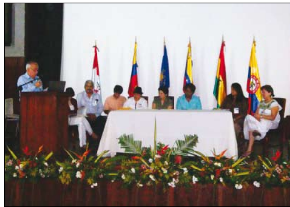
La Gobernadora de Portuguesa, Antonia Muñoz y los integrantes del panel en el Seminario