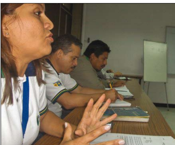
Mesas de trabajo entre funcionarios del IICA y la FUDECO

La oficina del IICA en Venezuela promovió el desarrollo rural con enfoque territorial como el eje aglutinador de la cooperación técnica en Venezuela. En ese contexto, en coordinación con la Gobernación del estado Portuguesa se realizó el I Seminario Venezolano de Desarrollo y Gestión Territorial, Portuguesa 2008, el cual contó con la participación de entidades públicas, académicas nacionales e internacionales, así como actores comunitarios de todo el país.