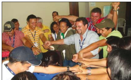
Dinámica grupal con los asistentes al I Foro Nacional de Jóvenes Líderes de la Agricultura