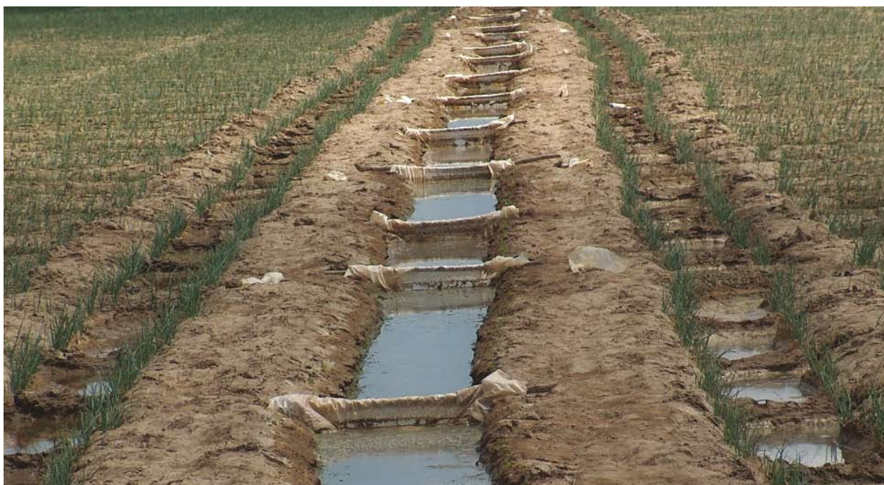
Cultivos de cebolla bajo riego en el valle de Quíbor, estado Lara