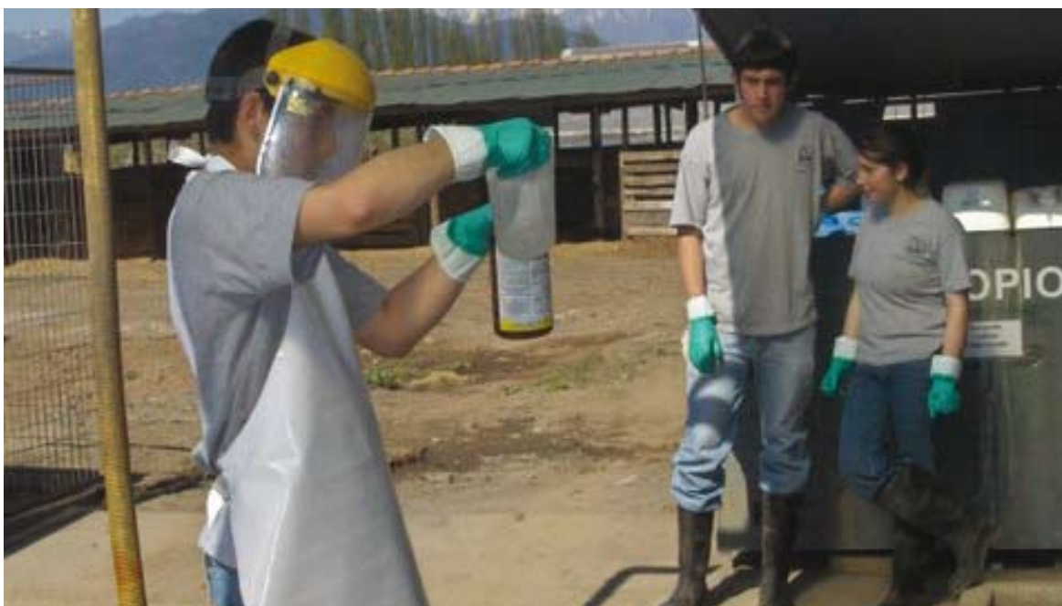
La sanidad agropecuaria como objetivo fundamental de la seguridad y la soberanía alimentaria