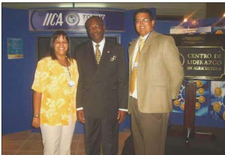
Director general del IICA con jóvenes líderes de Venezuela