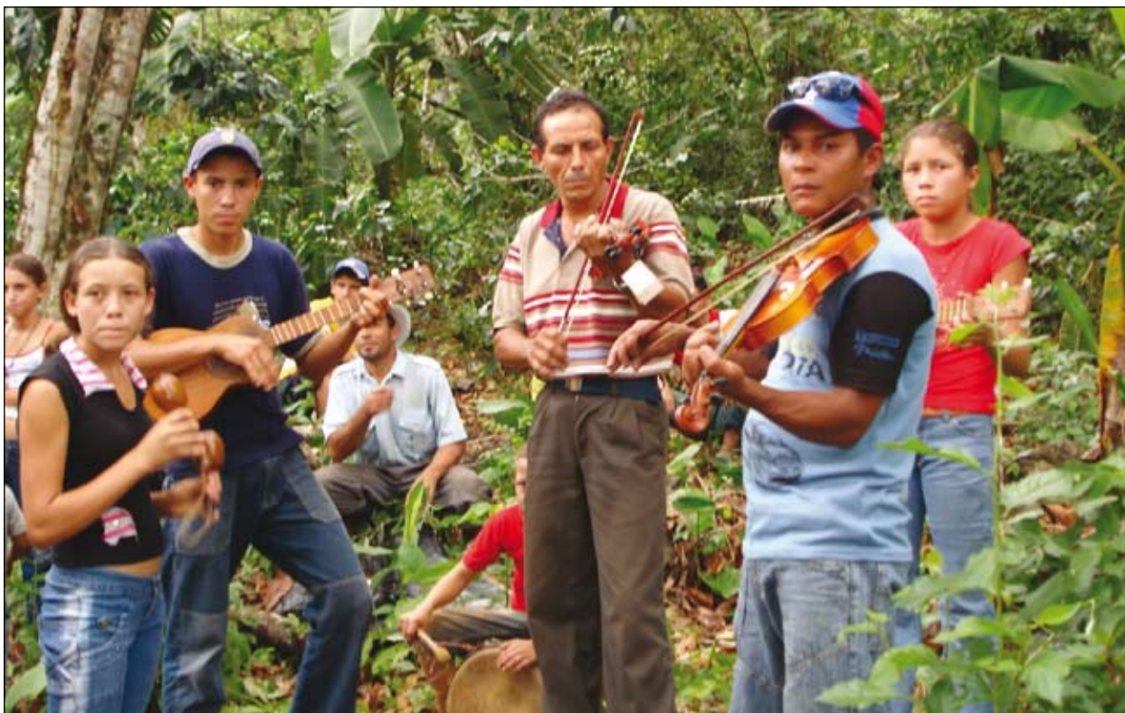
Fomento de las actividades no agrícolas en los ámbitos rurales de la región andina

Además lideró la preparación de la propuesta «Programa de Turismo Rural para la Región Andina», en coordinación con la Dirección de Operaciones Regionales (DORI) Andina y el Programa Hemisférico de Turismo, con el objetivo de fomentar la diversificación de actividades no agrícolas en los ámbitos rurales de la región andina, desde el fortalecimiento de las capacidades institucionales, el apoyo a la cadena de agronegocios y el mejoramiento de la calidad de vida rural.