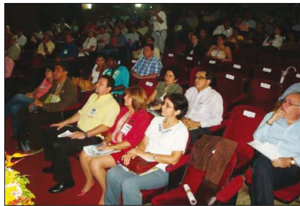
Seminario Venezolano de Desarrollo y Gestión Territorial, Portuguesa 2008