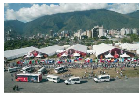
Vista Aérea de FITCAR 2006

En el stand, el IICA compartió con otros cinco co-expositores del sector público y de empresas privadas nacionales, quienes tuvieron la oportunidad igualmente de exponer sus experiencias en el ámbito rural en el manejo de diferentes productos turísticos y programas de desarrollo sostenible en cuanto a turismo solidario, evidenciando la importancia del buen manejo de elementos culturales y naturales en la oferta turística rural y su aporte a las economías agrícolas.