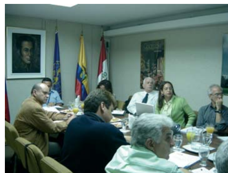
Reunión grupo Biotecnología

Los aportes venezolanos al PHBB se iniciaron con la asistencia de una delegación al taller “Identificación de Necesidades en Agrobiotecnología y Bioseguridad en la Región Andina”, realizado en Quito, Ecuador, el 23 y 24 de noviembre 2006. Dicha delegación estuvo conformada por representantes de los sectores gubernamentales, académicos y productores agrícolas, quienes dejarón explícita la posición de las instituciones e individualidades involucradas en la Biotecnología y la Bioseguridad en Venezuela.