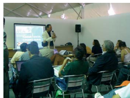
Asistentes Ciclo de Charlas