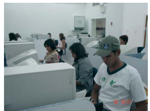
Participantes del Taller

Esta actividad es parte de la estrategia de coordinación interinstitucional para permitir la unificación de criterios para la conformación de una Biblioteca Nacional de Agricultura de Venezuela.