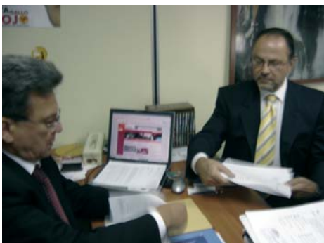
Firma del Convenio INATUR - IICA

Con el fin de compartir responsabilidades, y de trabajar mancomunadamente en el desarrollo sustentable del turismo rural; el Instituto Nacional de Promoción y Capacitación Turística (INATUR), y el Instituto Interamericano de Cooperación para la agricultura (IICA), firmaron un "Convenio Marco de Cooperación", el día 11 de diciembre de 2006.