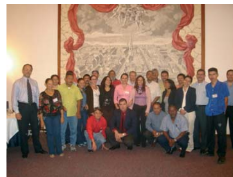
Participantes del Taller

2. Sistema de Trazabilidad en la Cadena Agroproductiva del Café.