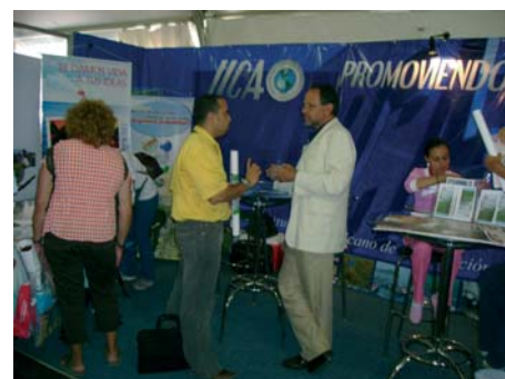
Stand IICA y Coexpositores Promoviendo el Turismo Rural en Venezuela